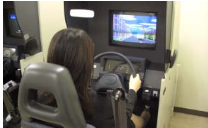
上)KM式運転適性助言検査 左)5分割マルチビデオ車(特許第4144480号)